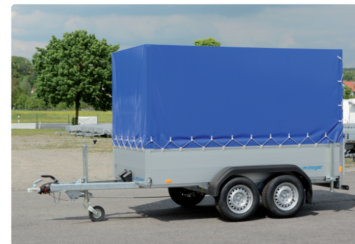
BT 2730/151 Zub.: Heckschiebestützen, Aluzwischenprofil zusätzlich, Plane BT 2730/151 Options : béquilles arr., profilés supplémentaires en alu, bâche BT 2730/151 Extras: prop stands, additional aluminium profile, canvas top