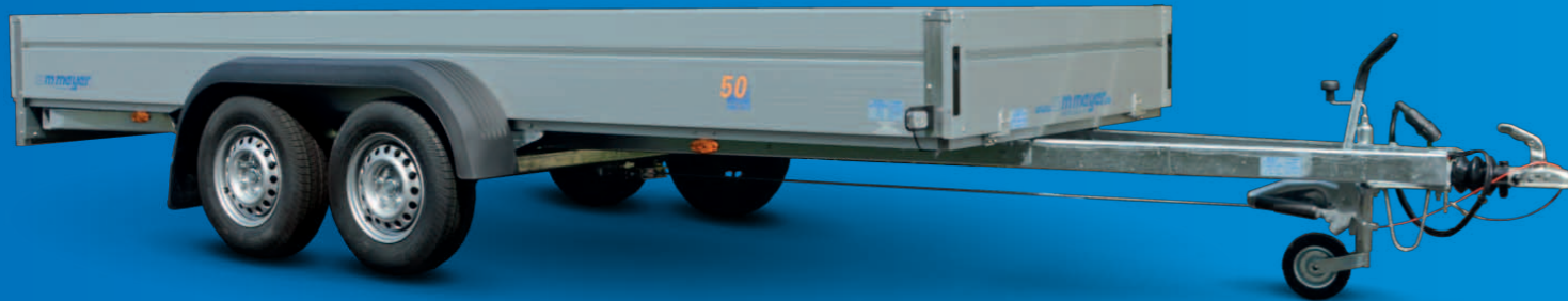
BT 2045/155 Zubehör: Stirnwand klappbar • BT 2045/155 Option : ridelle avant ouvrable • BT 2045/155 Optional extra: front panel which can be opened

Wir haben für jeden den passenden Anhänger!