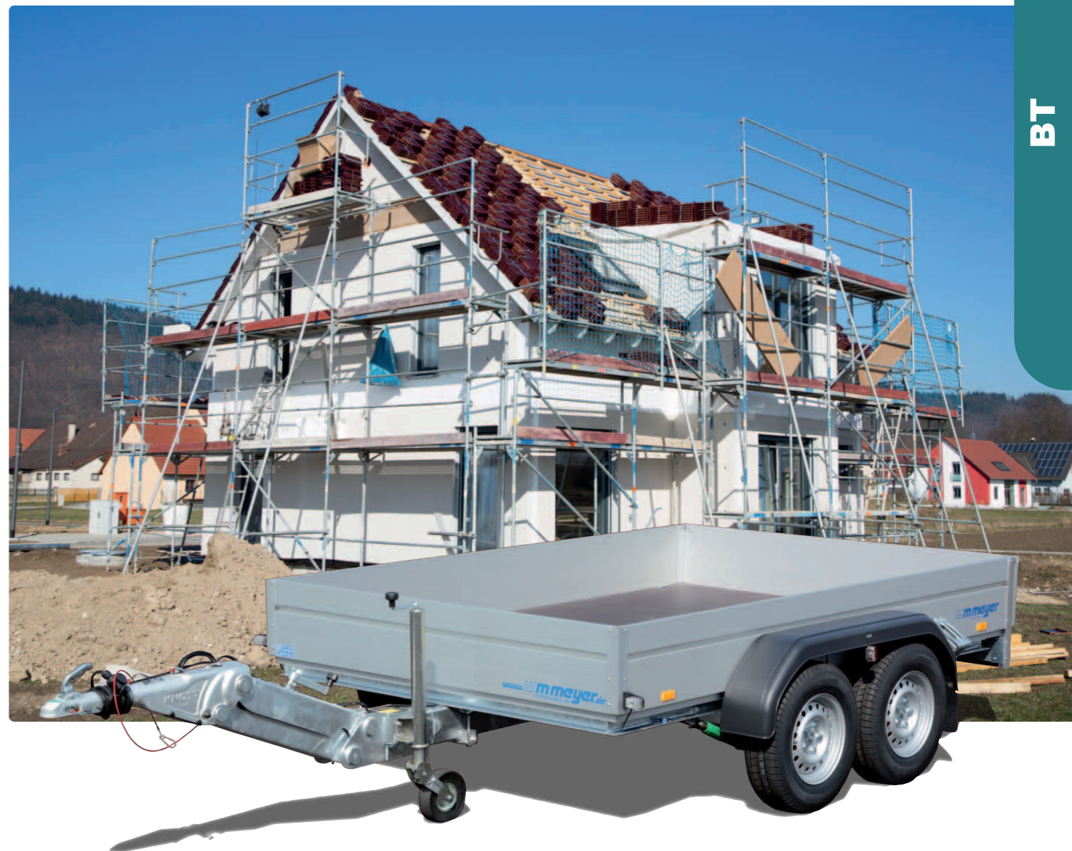
BT 3030/200 Zubehör: 100-km/h-Ausführung, Deichsel höhenverstellbar BT 3030/200 Options : kit « rouler plus confortablement », timon réglable en hauteur BT 3030/200 Optional extras: smooth-ride kit, drawbar adjustable in height