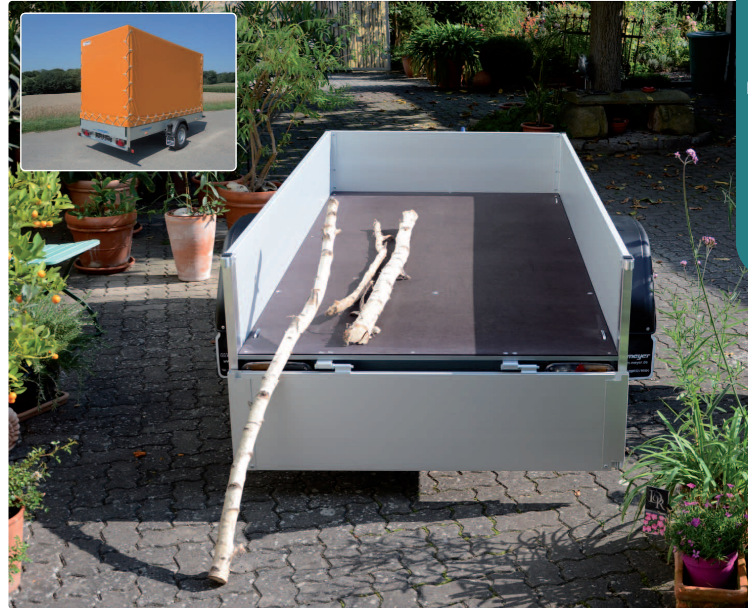
B 1325/126 Siebdruckholzboden, Aluminiumbordwände (Stärke: 25 mm, Höhe: 350 mm) ; kleines Bild: B 1335/151 Zubehör: Plane und Spriegel B 1325/126 Plancher en bois antidérapant imperm., ridelles en alu (épais. : 25 mm, H : 350 mm) ; petite photo : B 1335/151 Opt. : bâche et ossature en alu B 1325/126 High-density plywood platform, alum. panels (width: 25 mm, height: 350 mm) ; small picture: B 1335/151 Optional extras: canvas top and alumi-