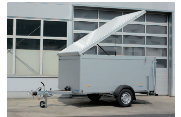
B 1530/185 Sonder Zub.: Stützen, höhere Bordwände, Sandwichaludeckel B 1530/185 Spéciale Options : béquilles, ridelles plus hautes, hardtop B 1530/185 Special Opt.: prop stands, increased side panel height, hardtop