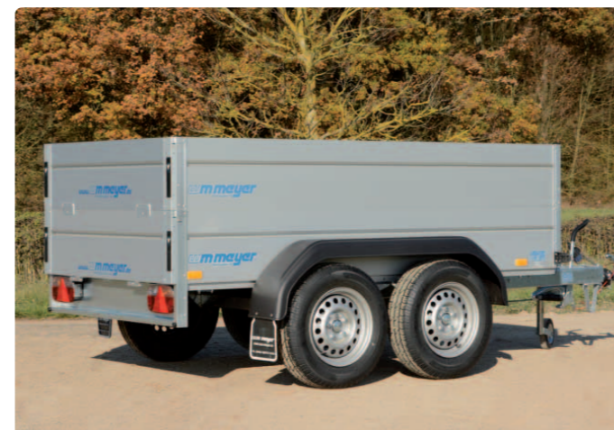
BT 2025/126 Zubehör: Bordwanderhöhung (ca. 350 mm) BT 2025/126 Option : ridelles supplémentaires en alu (350 mm env.) BT 2025/126 Extra: additional aluminium side panels (approx. 350 mm)