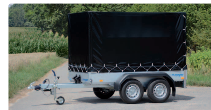
BT 2025/126 Zubehör: Plane und Aluspiegel (Höhe: 1.400 mm) BT 2025/126 Option : bâche et ossature en aluminium (hauteur : 1.400 mm) BT 2025/126 Optional extra: canvas top, aluminium support (height: 1,400 mm)