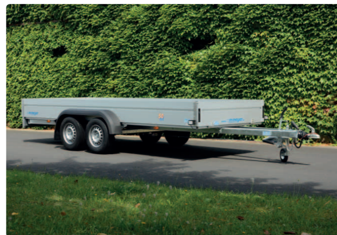
BT 2045/151 Zubehör: Stirnwand klappbar BT 2045/151 Option : ridelle avant ouvrable BT 2045/151 Optional extra: front panel which can be opened