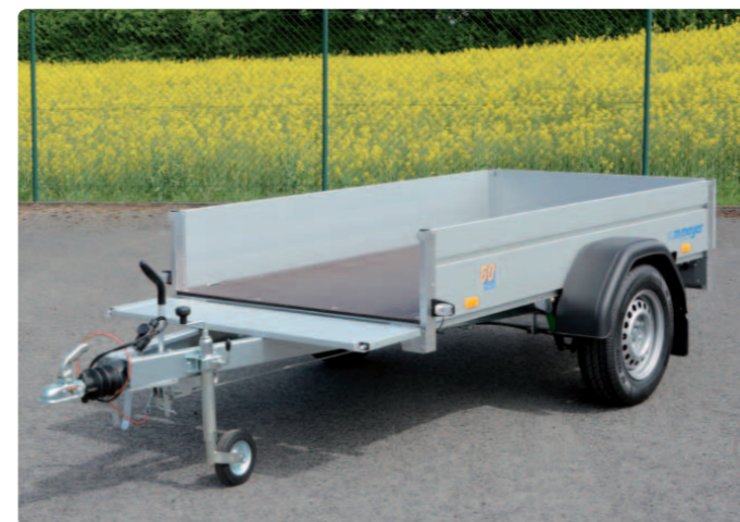
B 1325/126 Zubehör: 100 km/h, Stirnwand klappbar B 1325/126 Opt. : kit « rouler plus confortablement », ridelle avant ouvrable B 1325/126 Options: smooth-ride kit, front panel which can be opened