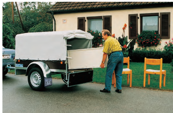
KH 751 mit Zubehör Dachgestell und Plane - größeres Ladevolumen geschützt vor Wind, Wetter und Verlieren.