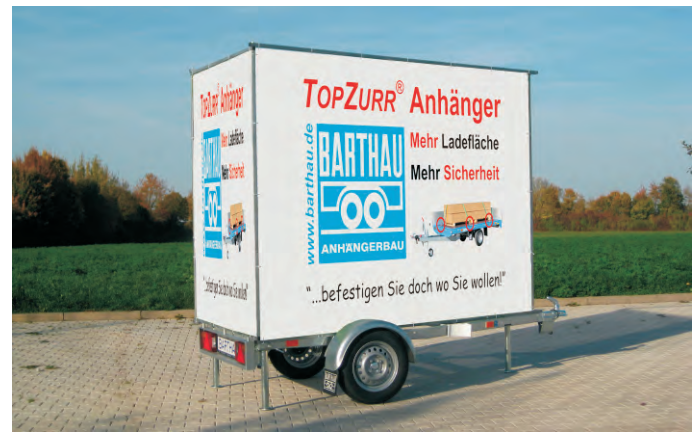
W 751 Werbeanhänger zum Aufspannen von drei Werbebannern.