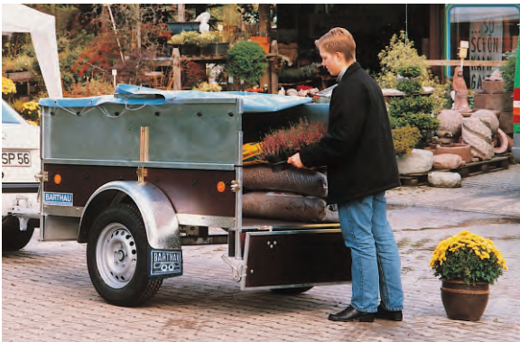
KH 751 mit Zubehör Aufsätze und blauer Flachplane. Planen können in vielen Farben bestellt werden ( grau ist serienmäßig ).