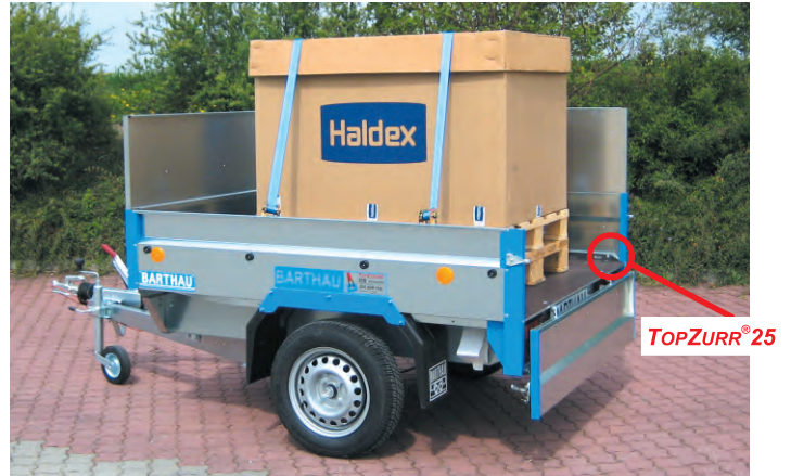
BLH 751 B serienmäßig gebremst mit Zubehör Blechaufsatz.